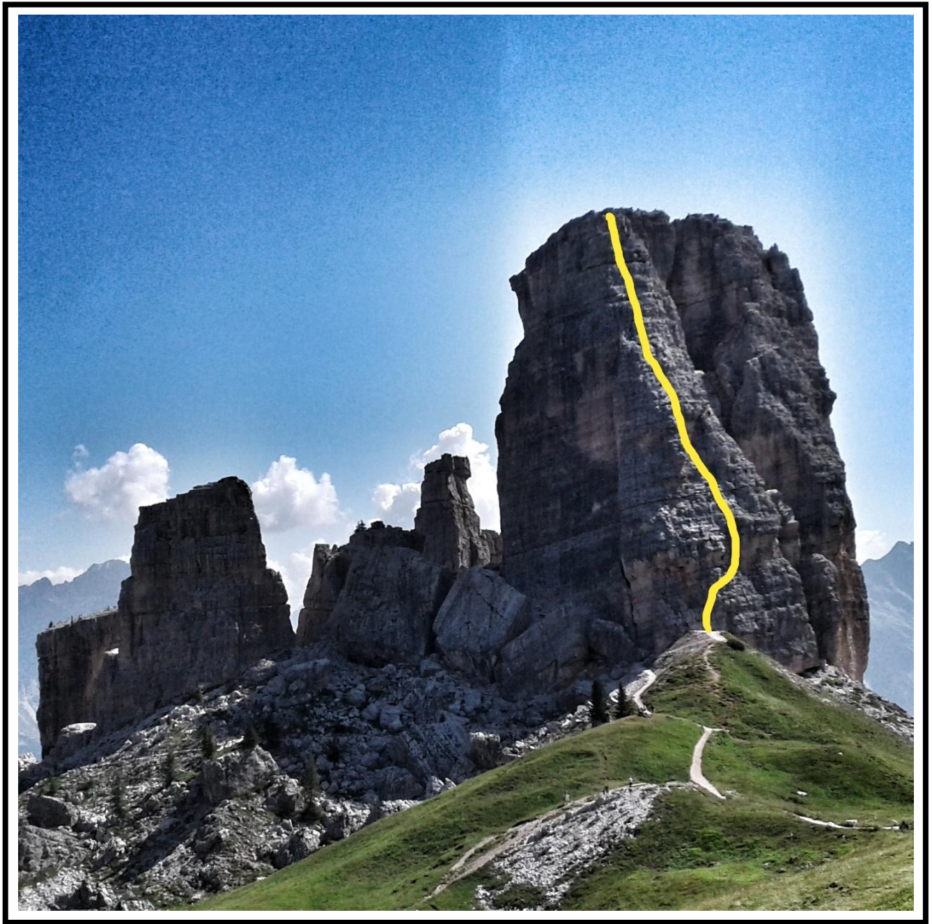
Tracciato della via